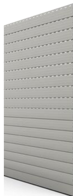
REMATE LP 55 EC